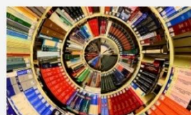
WORK PACKAGE 1 – BUILDING ON AVAILABLE KNOWLEDGE