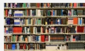
WORK PACKAGE 2 – PREPARATION OF INTEGRATED BUILT HERITAGE REVITALISATION PLANS (IBHRP)