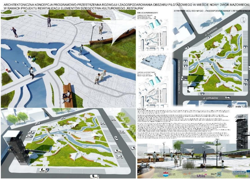
ARCHITEKTONICZNA KONCEPCJA PROGRAMOWO-PRZESTRZENNA ROZWOJU I ZAGOSPODAROWANIA OBSZARU PILOTAŻOWEGO W MIEŚCIE NOWY DWÓR MAZOWIECKI, W RAMACH PROJEKTU REWITALIZACJI ELEMENTÓW DZIEDZICTWA KULTUROWEGO „RESTAURA”