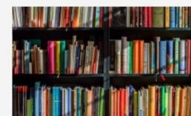
WORK PACKAGE 3 - PILOT TESTING AND EVALUATING OF PPP APPROACH EVALUATING OF PPP APPROACH