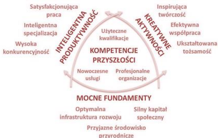
Rysunek 2 Układ celów SRWW-M